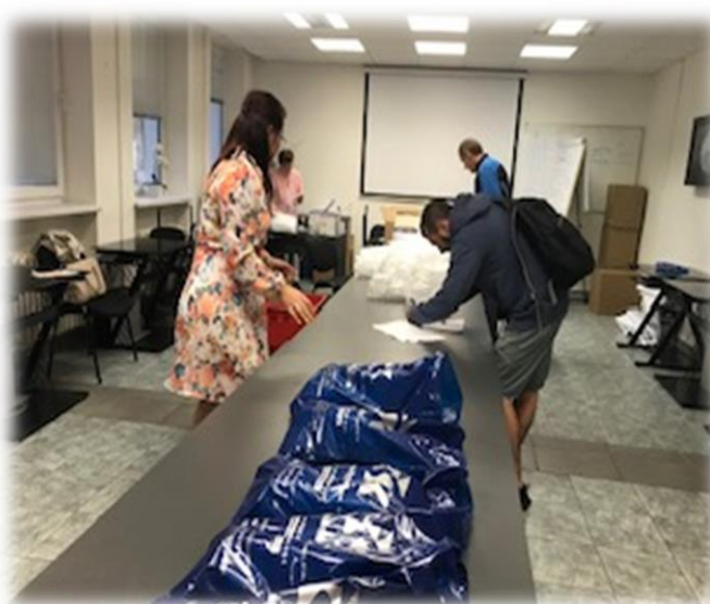
Rozdávání balíčků s uzeninami a skleničkami