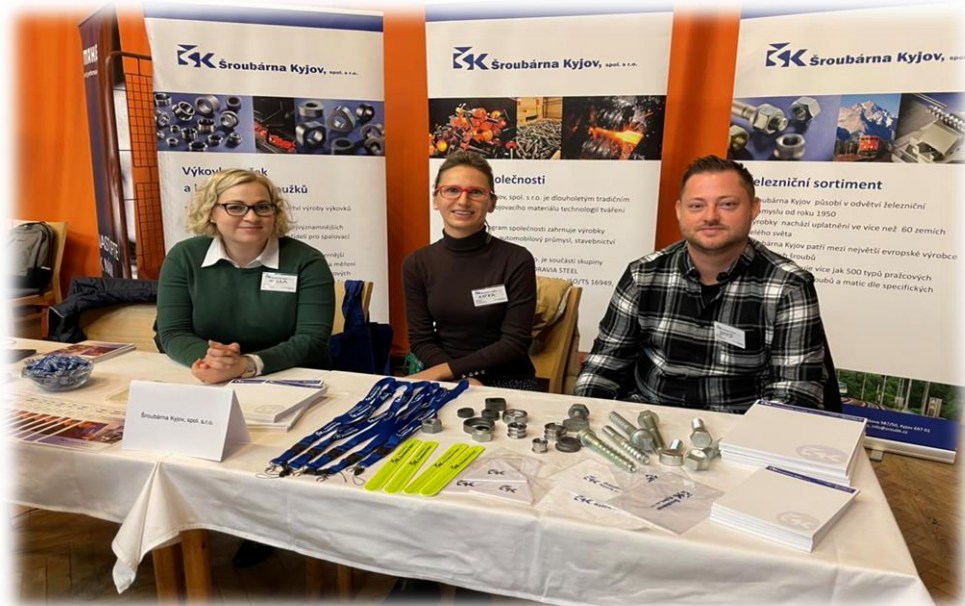
Veletrh pracovních příležitostí

Dne 20. 10. 2022 pořádala Okresní hospodářská komora v Hodoníně Veletrh pracovních příležitostí. Veletrh je určený pro zájemce hledající pracovní uplatnění, brigády či studentské stáže, případně pro ty, kteří potřebovali jen poradit a získat kontakty na potenciální zaměstnavatele. Na veletrhu se představila dvacítka zaměstnavatelů a poradenských organizací, včetně Šroubárny Kyjov, spol. s r.o.