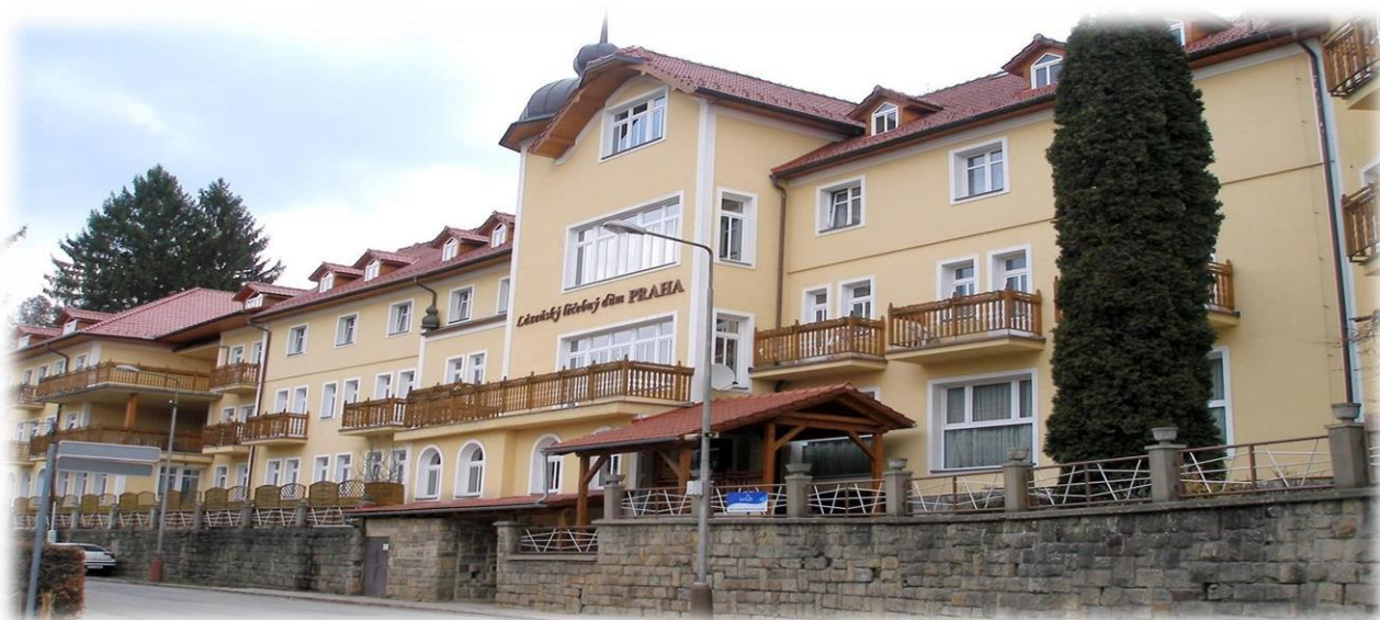
Lázeňský léčebný dům Praha Luhačovice