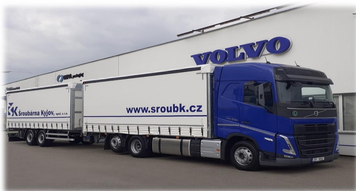
Nový nákladní automobil ŠK

Vozový park střediska dopravy byl rozšířen o nový nákladní automobil s přívěsem.