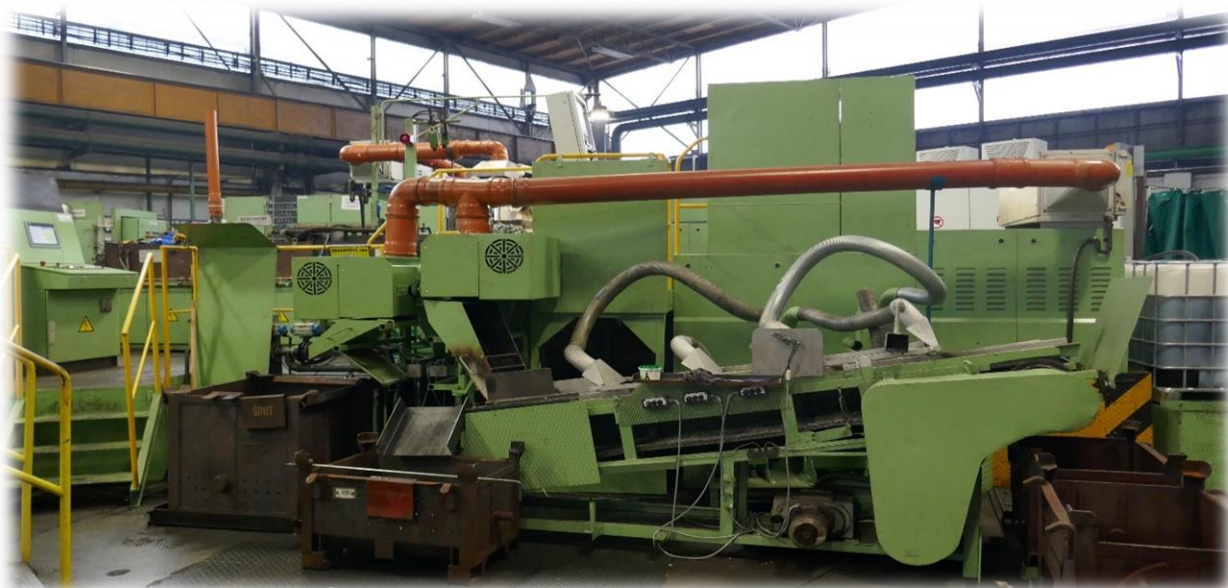
Kovací linka s novým lisem AKS63-H4

Vozový park střediska dopravy byl rozšířen o nový nákladní automobil s přívěsem.