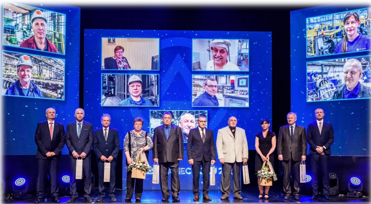
Prestížní slavnostní akce Třineckých železáren „Královna ocel“.

Dále poskytujeme odměny při životních jubileích a odchodu do důchodu (částky byly nově navýšeny a odstupňovány v závislosti délky trvání pracovního poměru), oceňujeme nejlepší zlepšovatele.